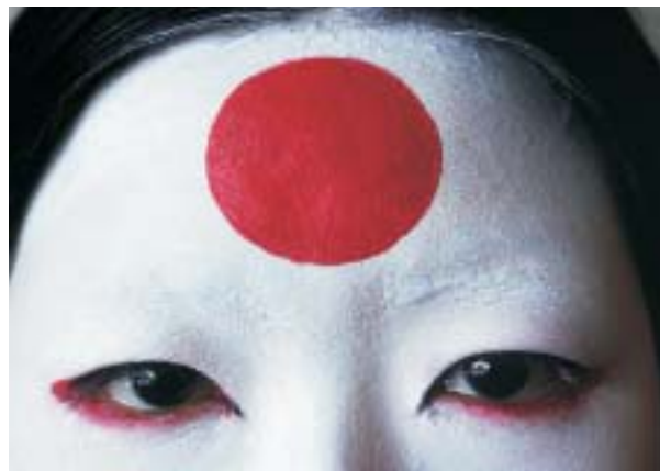
'Japanese Face'

Tintas HP Vivera baseadas em corante fornecem profundidade rica de cores, visibilidade mínima de pontos e brilho uniforme—importantes atributos da qualidade da imagem.