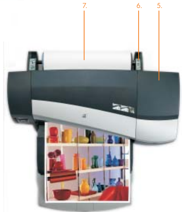
Vista superior da impressora HP Designjet 90r